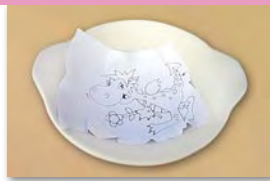
mit Bleistift vorskizzieren oder Vorlage durchpausen