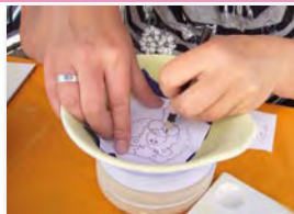
gewählte Vorlage durchpausen oder selbst skizzieren