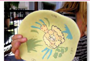
... fertig zum Brennen