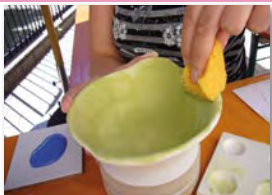
Rohling mit Schwamm oder Pinsel grundieren

kaaro. Keramik-Malmöglichkeiten Anfragen: 06127/99 29 56 oder info@kaaro-keramikmalstudio.de