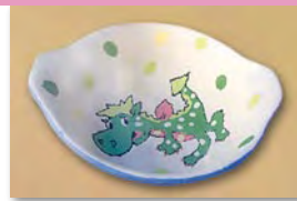
Farben (pastellig) vor dem Brennen