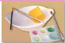
Rohling, Pinsel, Farben, Vorlagen aussuchen