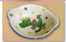
Farben (kräftig und glänzend) nach dem Brennen